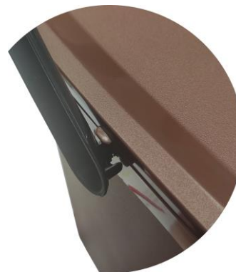
PESTAÑA CIERRE DE SEGURIDAD. PAPELERA ABIERTA