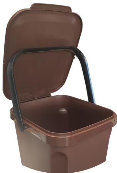
FÁCIL DE SUJETAR LA TAPA CON EL ASA