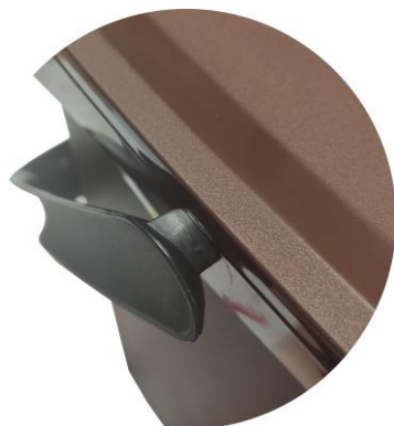
CIERRE DE SEGURIDAD