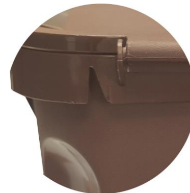
ANCLAJES EN EL BORDE DE LA BOCA PARA FIJAR LA BOLSA